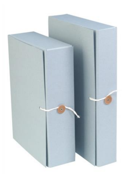
Nappi & nauha-arkistokotelo