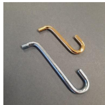
Depot hook M4 ja M5

M4 (pari) Tuotenumero: 11-001 à 15,50 € (12,50 €)